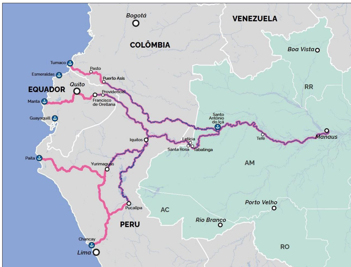
Figura 2 – Ruta de Chancay

La existencia de rutas concurrentes, como el corredor interoceánico central vía Chancay, en Perú, pone de relieve el carácter competitivo de los proyectos de integración regional. El puerto de Chancay, con inversiones chinas y una localización más septentrional, ofrece una ruta directa hacia Brasil a través de Acre, Rondônia y Bolivia, siendo señalado como un posible eje dominante para las exportaciones con destino a Asia (Brasil, 2024a, p. 24).