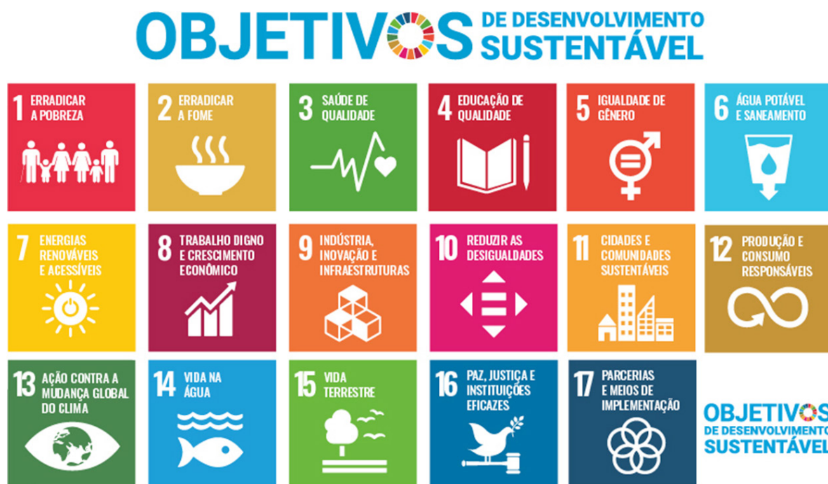
Figura 1 – Objetivos de desenvolvimento sustentável propostos pela Organização das Nações Unidas