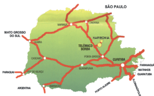
Figura 1 - Mapa do estado do Paraná ressaltando Telêmaco Borba e Harmonia, região que abriga a Klabin

A marca dos empreendedores sempre foi buscar a inovação, o que exigia viagens regulares à Europa em busca de novas técnicas de produção. Dentro desse espírito, a empresa deu seu grande salto, em 1934, com a fundação da Klabin do Paraná, a primeira fábrica integrada de celulose e papel do País. (KLABIN, 2003).