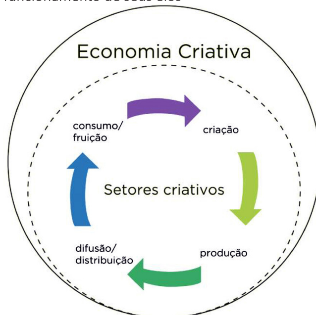
Figura 3 – Economia criativa e a dinâmica de funcionamento de seus elos