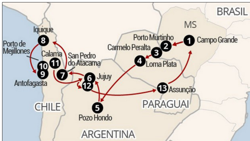
Figura 1 – Rota bioceânica