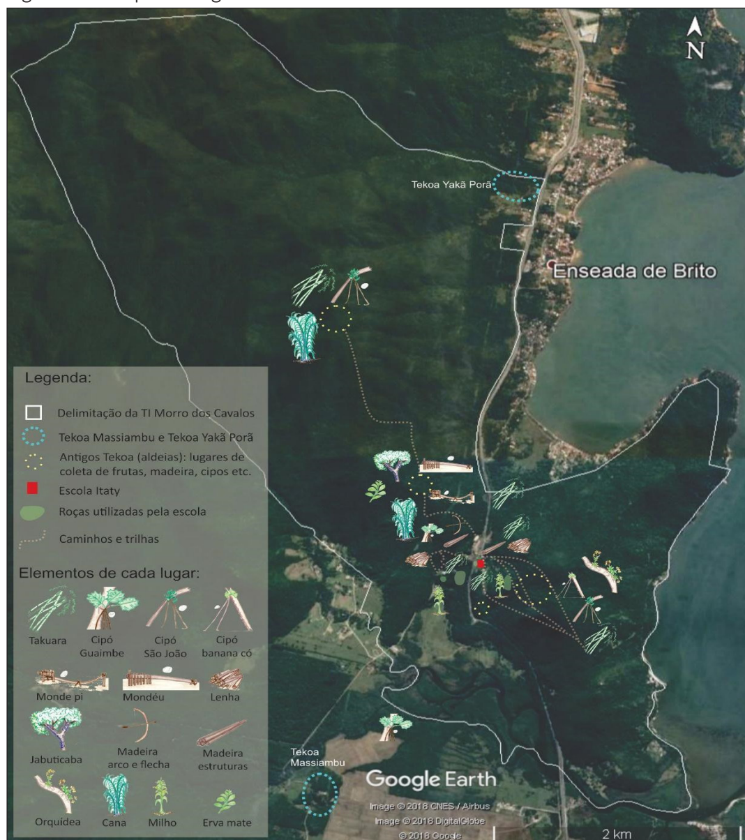
Figura 10 – Mapa dos lugares de coleta de materiais utilizados nas atividades escolares

Fonte: Foto de satélite do Google Earth (2018) com a delimitação da TI segundo a Funai. Imagem editada por Nauíra Zanardo Zanin com base no mapeamento realizado por professores da Escola Itaty. Desenhos da legenda: Jaxuka e Nauíra Z. Z.