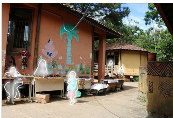
Figura 7 – Venda de artesanato durante a Semana Cultural