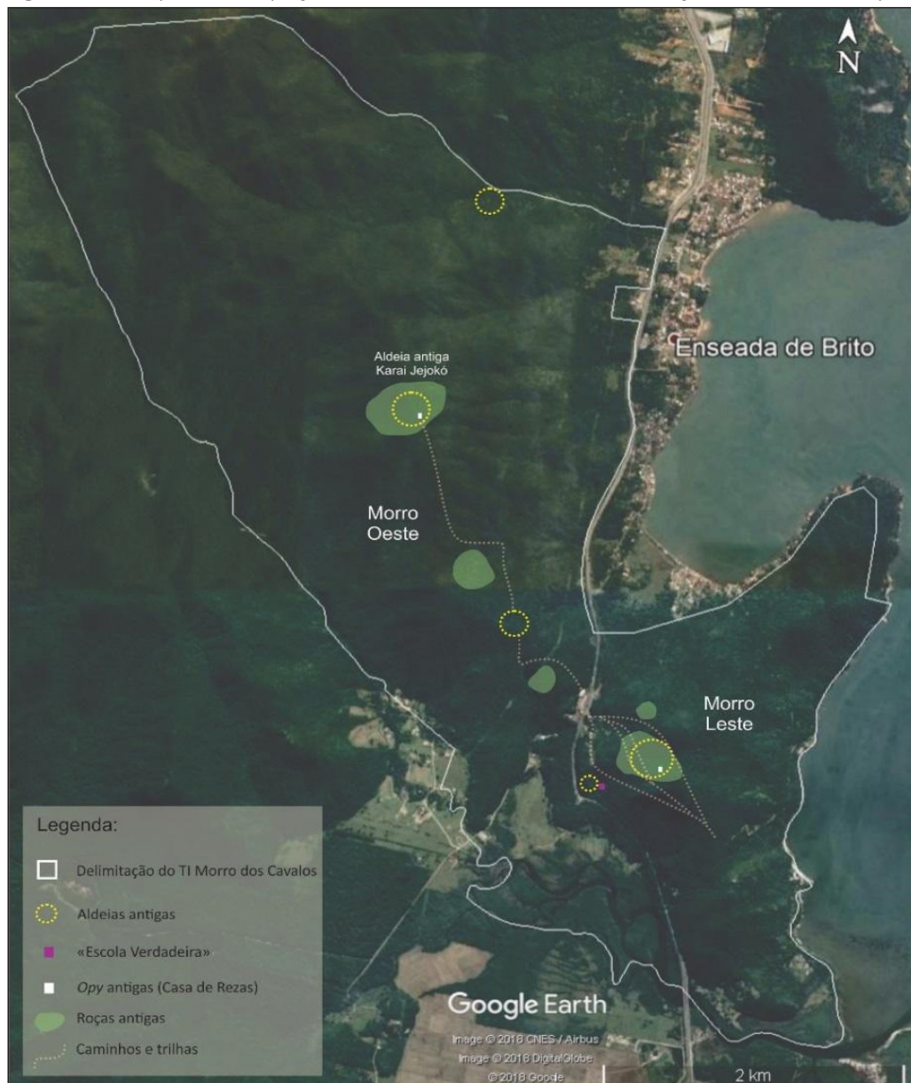
Figura 2 – Mapa de ocupação do território antes da construção da Escola Itaty