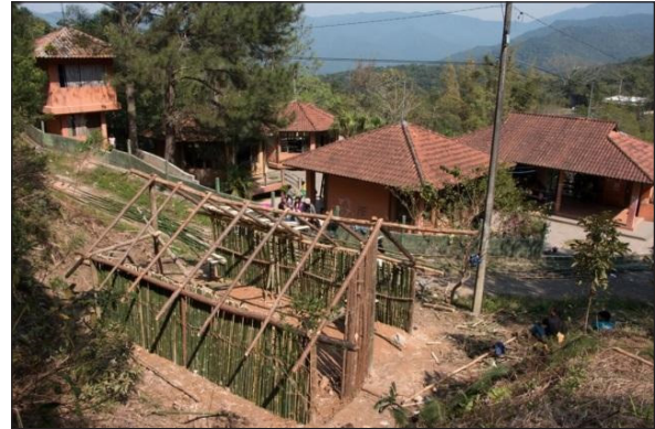
Figura 9 – Opy Mirĩ sendo reconstruída junto à Escola Itaty, em agosto de 2016