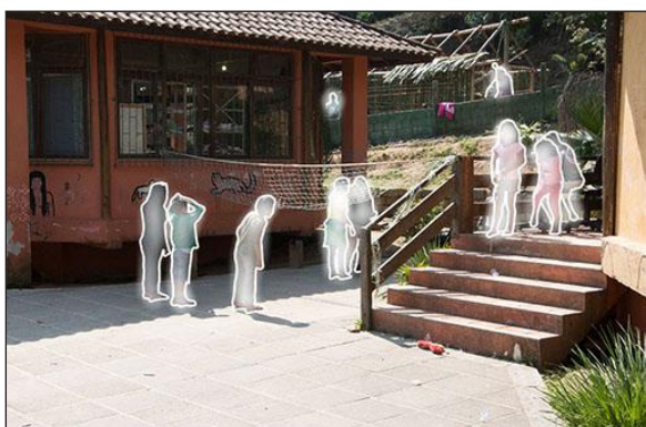
Figura 6 – Jogo de vôlei entre as salas da escola