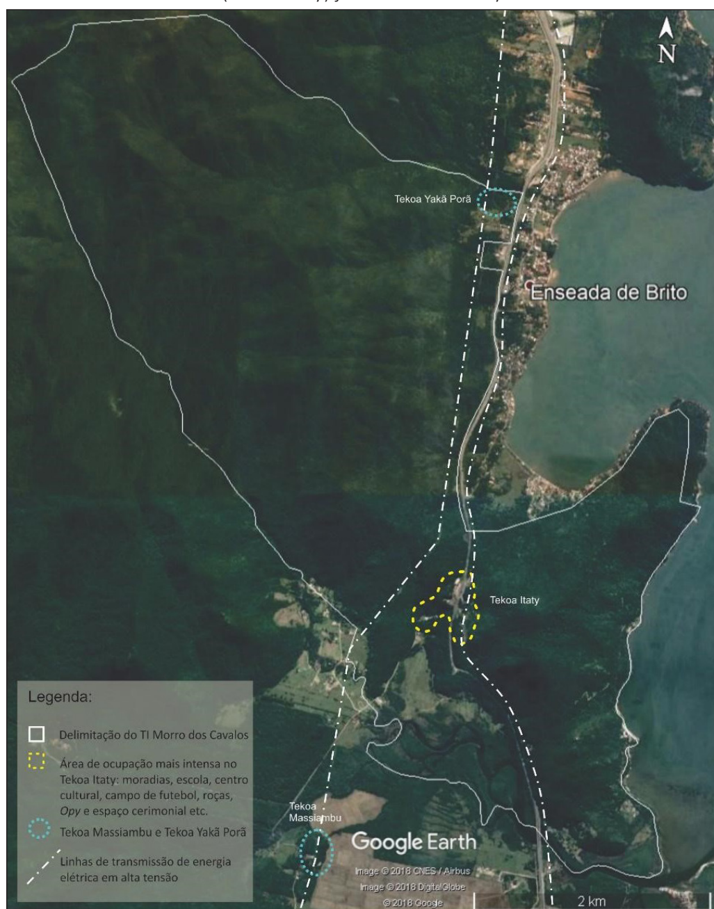
Figura 5 – Mapa sobre foto de satélite indicando a área de ocupação mais intensa da TI Morro dos Cavalos (Tekoa Itaty) junto à Escola Itaty