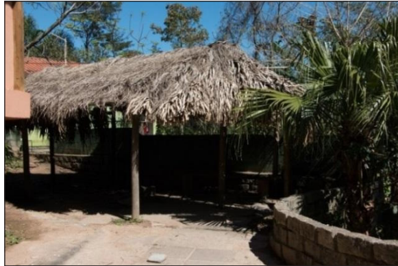
Figura 8 – Ramada para o fogo, em 2016, coberto com pindó e karandá